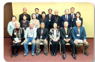
令和5年度 関西カワセミ会の様子