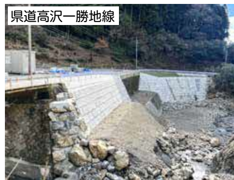
県道高沢一勝地線