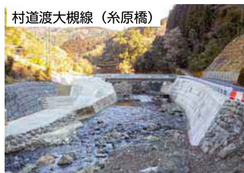
村道渡大槻線（糸原橋）