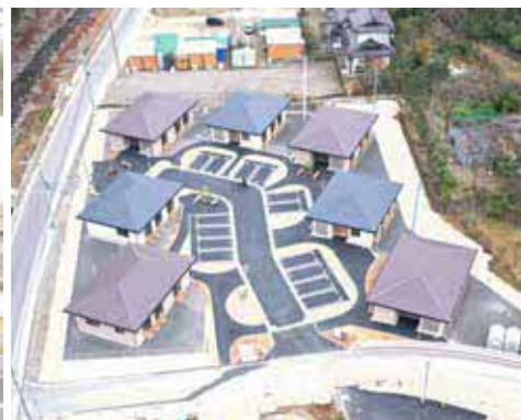
▲ 完成した村有住宅神瀬団地