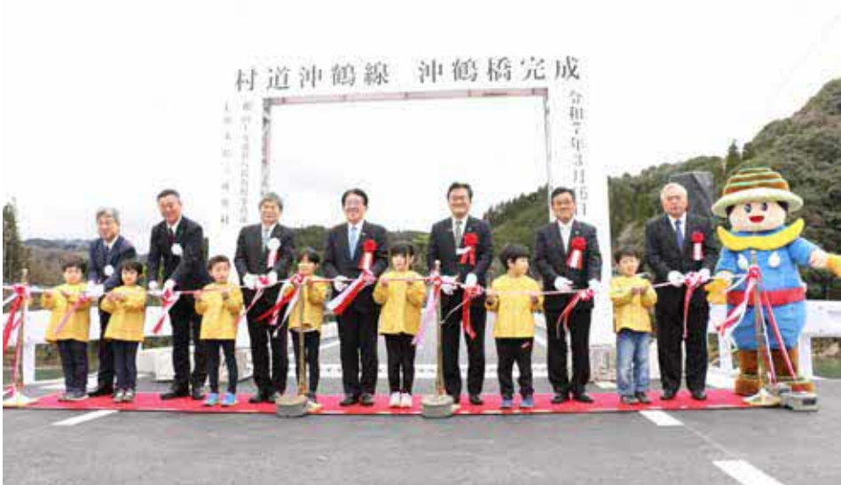
▲ 出席者によるテープカット