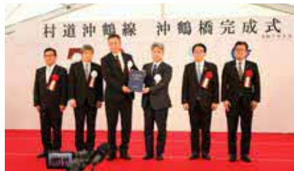
▲ 九州地方整備局から村へ引き渡し