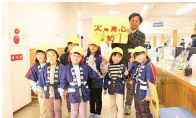
役場を訪れたこがね保育園の園児

3月7日、こがね保育園の園児が春の火災予防運動に合わせ、防火パレードを行いました。