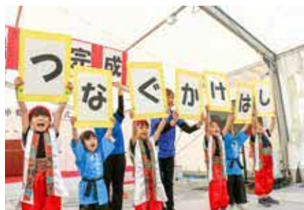
▲ 渡保育園園児によるオープニングセレモニー