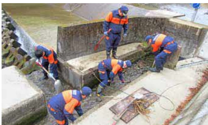
用水路を清掃する第2分団

3月2日と9日に、令和2年7月豪雨で被災した地ノ内水路の農地復旧に伴い、地域住民や消防団第1分団・2分団、建友会など延べ101人が集まり、用水路の清掃作業が行われました。