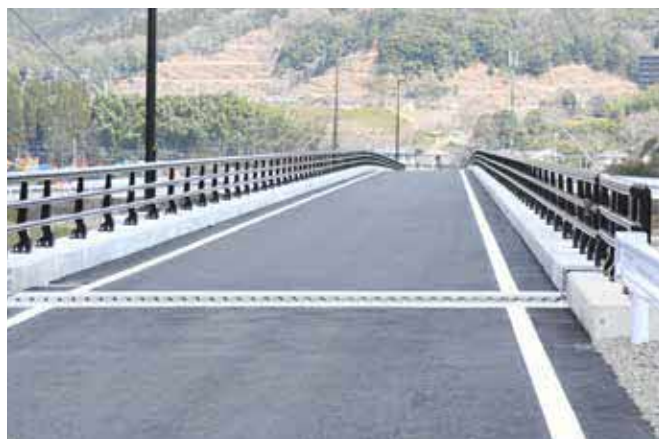
▲ 左岸側から見た沖鶴橋