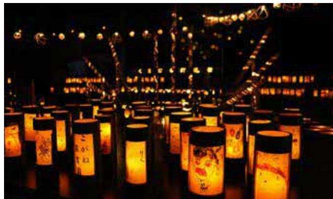
園児が作った竹灯籠

2月22日、さんがうら運営委員会主催のくまむら灯籠祭が田舎の体験交流館さんがうらで開催されました。ことしの竹灯籠は、渡・こがね保育園の園児や来場者が作った灯籠などが飾られており、会場は優しい明かりに包まれていました。また、ジビエや一勝地赤豚を使った豚汁、カレー、揚げパンなどのバザーもあり、多くの来場者は地元の食を楽しみました。