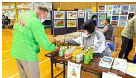
▲ ご購入いただきありがとうございます

3月2日に開催された第28回球磨村文化祭&生涯学習フェスティバルで、ジュース販売を行いました。団員もステージ発表を楽しみながら、販売を通して、皆さんと交流することができました。