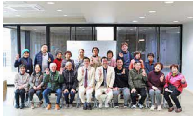
最後にみんなで記念撮影

12月26日、「あおぞら花月 in 球磨村」が村営住宅エスプランサ桜峯と高齢者福祉センターせせらぎで開催されました。