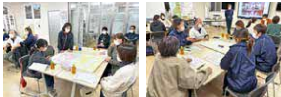
福祉について意見交換