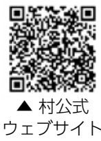
▲村公式ウェブサイト