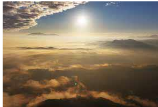
大久保地区から見える「雲海」

【短歌】 年の瀬に 風邪こじらせて 寝込みをり 福岡の 孫はお節を 人吉に断る 同居する 孫の母子は 熊本へ 明け早々 息子夫婦と 年越しそばを 地震に火事と 雪までも いろんな事故に 心いたみぬ 鳥飼可津子