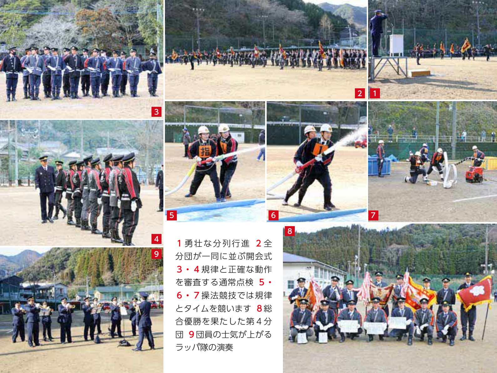
1 勇壮な分列行進 2 全分団が一同に並び開会式 3・4 規律と正確な動作を審査する通常点検 5・6・7 操法競技では規律とタイムを競います 8 総合優勝を果たした第4分団 9 団員の士気が上がるラッパ隊の演奏

最後に、球磨村は、山間部が多く、また、日本三大急流の一つである球磨川を有しています。今後はより大きな災害がないとも言いきれませんが、令和二年の水害で被害が少なかつた場所も、今後はどうなるかわかりません。浸水だけでなく、土砂崩れの危険性もあります。そのため、復興だけでなく、今後予測される災害を事前に防ぐための村づくりが大切であると考えます。もう二度とあのようなことが起きないためにも、球磨村復興まちづくり計画の検討は大切だと思えました。私たちが球磨村出身の若い力が今こそ団結すべきだと思います。今はみんなそれぞれの場所で頑張っていますが、将来地元に戻って、力を合わせ球磨村の復興、再建のために尽力していきたいと思えます。