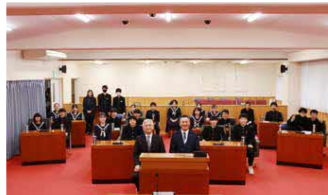
議員を務めた球磨中3年生

12月21日、中学生子ども議会が役場の議場にて開かれ、球磨中学校3年生26人が体験しました。