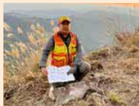
有害鳥獣駆除の様子