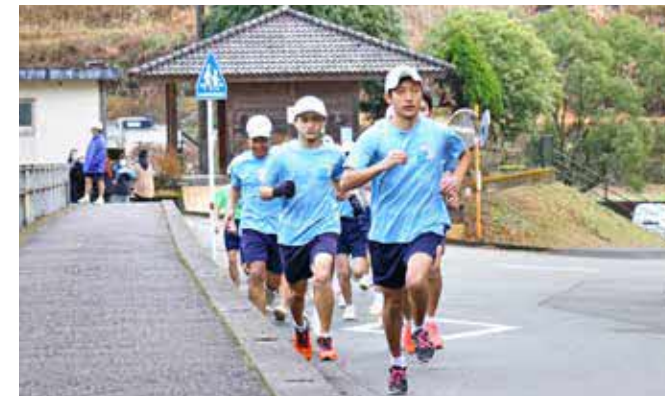
寒さに負けず力走する生徒たち