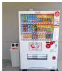
設置されている自動販売機

今後このような交流を続け、村の復興、福祉の推進に取り組んでいきます。 共同募金会球磨村分会(球磨村社会福祉協議会内)では、エスペランサ桜峯、ルミエール永崎の2カ所に自動販売機を設置しました。 今回設置した自動販売機の売り上げの一部は、赤い羽根共同募金へ寄付され、子どもたち・高齢者の方々・災害支援など、村の地域福祉のために使われます。いつも通り飲み物を購入していただくだけで、寄付ができるようになっていきますので、皆様のご協力をお願いします。