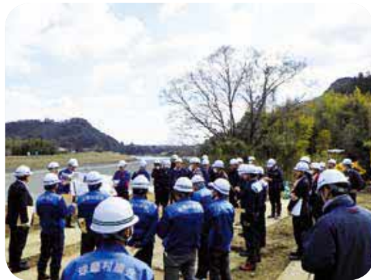
工事概要・進捗状況について説明を受ける参加者