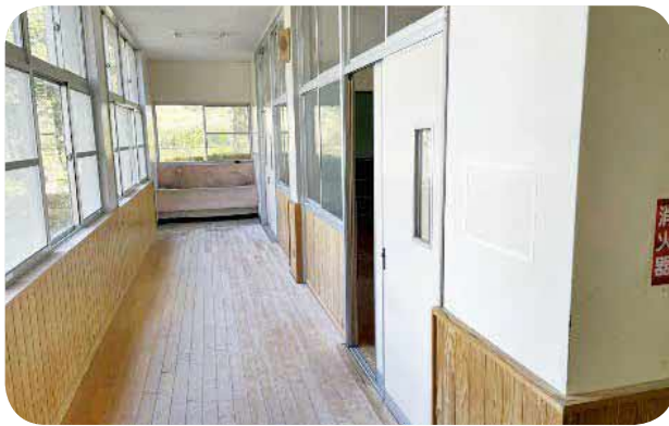
球磨中学校の空き教室を改修

また、屋内運動場に取り付けられている校歌、校訓、校章の看板を取り外し、球磨清流学園の各看板に取り付けるもので、原案のとおり可決。