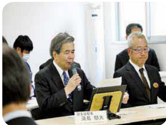
報告会には蒲島県知事も出席