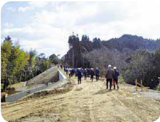
沖鶴橋工事用道路を歩いて視察

視察を終えた後、国交省と熊本県に対して、早期の工事竣工と工事用道路の共用についての要望を行いました。