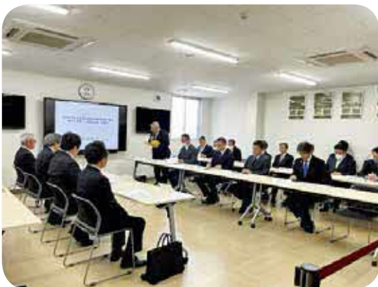
防災センター会議室で行われた報告会

塚ノ丸団地の宅地整備については、令和6年3月には第1期分の造成工事が終了し、4月からは第2期造成工事が始まる予定であることから、意見交換では今後の事業実施に向けた要望も出されました。